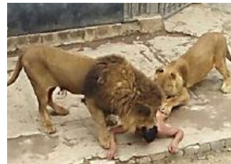
Quel gorilla abbattuto per salvare il ragazzino...