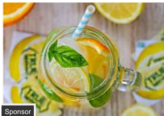
Ecco un semplice trucco per perdere peso! (Blog di Pianeta Donna)