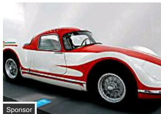
Le più belle Supercar di sempre (Foto) (Motori.it)