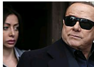
La Rossi va via Cerchio magico tra danni e addii