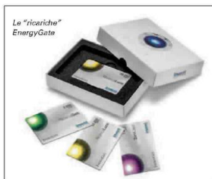
Le "ricariche" EnergyGate

l'imprenditore, "immaginiamo una città in cui tutte le case grazie a EcoModo generano ognuna autonomamente un 10% di energia pulita, allora avremo davvero dato un contributo per lasciare un mondo migliore ai nostri figli".