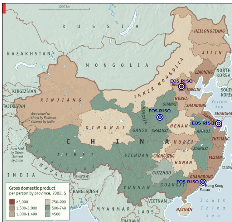
PIL pro capite suddiviso per province (fonte: The Economist, Behind the mask, 18 marzo 2004) e sedi EOS RISQ

Un mercato dove il consumo di riso è diminuito del 5% e quello dei telefoni cellulari è cresciuto del 168% .