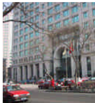
Canway Building, sede in Pechino di EOS Risq China

La Divisione Affari Internazionali di Assiteca, opera per la Clientela Italiana quale coordinatore centrale per tutti gli aspetti assicurativi esteri, inclusa Cina, con interazione fra la sede della Casa Madre