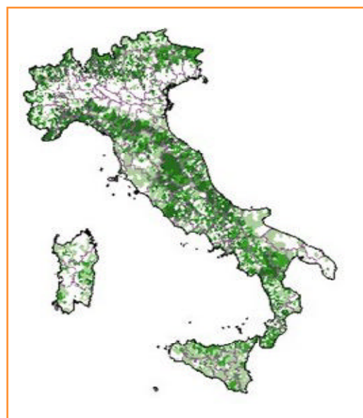
Rischio idrogeologico in Italia (in verde le zone colpite da frane negli ultimi 80 anni)

Purtroppo gran parte del territorio italiano è particolarmente a rischio rispetto a questi eventi: complessivamente è considerato a rischio sismico il 45% della superficie del territorio nazionale, nel quale risiede il 40% della popolazione. Per quanto concerne le garanzie assicurative oggi prestate, la polizza relativa ai terremoti prevede la liquidazione dei danni provocati direttamente dall'evento, ma vengono esclusi i danni prodotti da eruzioni vulcaniche, inondazioni e maremoti che in realtà spesso si verificano insieme agli eventi sismici.